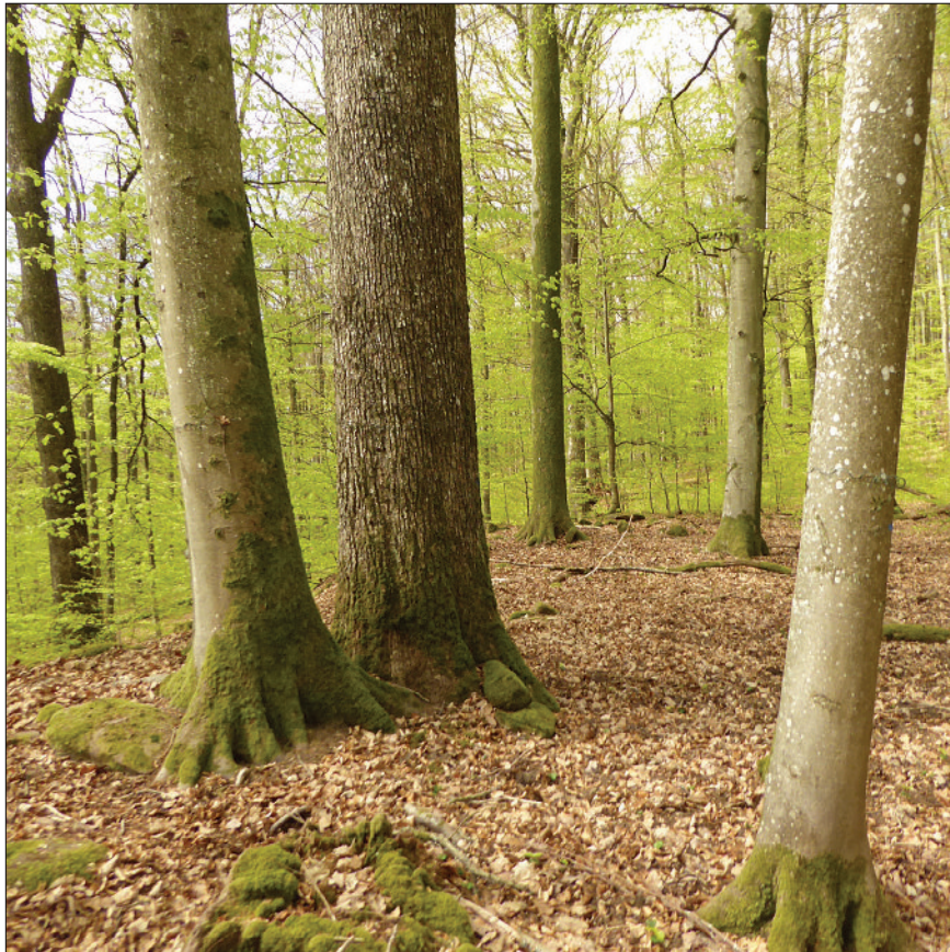
Photo 3 Hêtre en compétition avec le Chêne sessile. Réserve intégrale du Palatinat

D'autres données, issues de 12 carottes effectuées sur les plus gros chênes sessiles dans la réserve du Palatinat toute proche [données issues d'un rapport interne de Friedrich (2008), autorisation de publication Patricia Balcar], ont été utilisées en complément d'information (photo 3, ci-dessous).