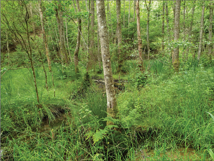
Photo 2 Aulnaie, fond de vallon, Mouterhouse