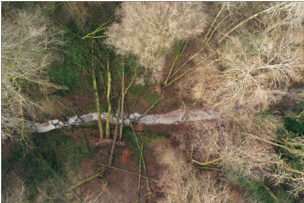
Photo 4 Vue verticale (drone) d'une trouée de la hêtraie au sud-ouest de Lengelsheim (nord de Bitche)

Ainsi, 46 futaies de chênaies appartenant à toutes les catégories sont décrites totalement déperissantes, par pans entiers de montagnes, ce qui n'est jamais observé pour les hêtraies. Parmi les arbres isolés, ils notent aussi 476 gros chênes isolés morts contre 36 hêtres.