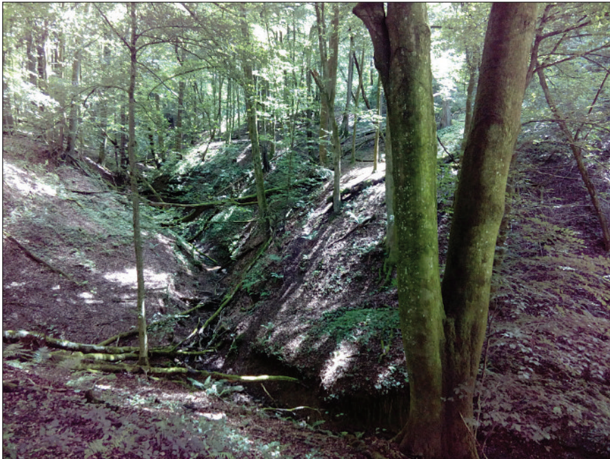
Photo 1 Hêtraie de ravin hors gestion depuis le début du XX e siècle, localisée au sud-ouest de Lengelsheim (nord de Bitche).

Les formations forestières potentielles sont pour l'essentiel la hêtraie ( Fagus sylvatica ) du Luzulo-Fagetum (Muller, 1986), au sein de laquelle s'insère le Chêne sessile ( Quercus petraea ) (photo 1, ci-dessous), sauf dans les fonds de vallon, dominés par l'aulnaie ( Alnus glutinosa ) (photo 2, p. 363). Les récentes recherches en palynologie dans la région confortent les études actuelles : il apparaît que le Hêtre domine le spectre pollinique entre 3910 BP et 2990 BP (Gouriveau, 2020), avant d'être fortement limité par des usages favorisant le Chêne. Ces forêts incluent d'autres espèces en petites densités, comme le Charme ( Carpinus betulus ) au bas des pentes dans les sites enrichis en limons fins, le Tilleul à petites feuilles ( Tilia cordata ), l'Orme lisse ( Ulmus laevis ) et les Érables ( Acer campestre , A. pseudoplatanus , A. platanoides ). Le Pin sylvestre ( Pinus sylvestris ) semble trouver dans ces milieux pauvres et sableux de la partie orientale des conditions particulièrement propices, en situation de sol à engorgement temporaire ou en conditions très drainantes, et dans les successions. Il est très bien représenté dans les diagrammes polliniques de tout l'Holocène (Gouriveau, 2020).