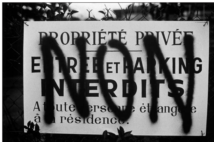
L'accumulation de plaintes de la part des habitants en raison des conflits, les réactions vives de certains usagers face à des aménagements et des arrêtés pris par le conseil municipal, l'apparition de clôtures ou de panneaux le long des propriétés sont autant de signes d'alarme persistants qui conduisent les élus à augmenter leur engagement sur ce type de dossiers.

« Le PNR, je pense que c'est peut-être un avantage, pas sur toute la ligne, pour éviter ces pressions de la périphérie de Paris, pour conserver notre village comme il est. J'ai peur que des gens arrivent. Il ne faut pas être trop égoïste... un certain partage