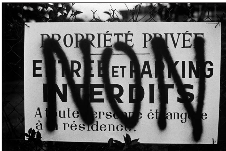
L'accumulation de plaintes de la part des habitants en raison des conflits, les réactions vives de certains usagers face à des aménagements et des arrêtés pris par le conseil municipal, l'apparition de clôtures ou de panneaux le long des propriétés sont autant de signes d'alarme persistants qui conduisent les élus à augmenter leur engagement sur ce type de dossiers.

" Le PNR, je pense que c'est peut-être un avantage, pas sur toute la ligne, pour éviter ces pressions de la périphérie de Paris, pour conserver notre village comme il est. J'ai peur que des gens arrivent. Il ne faut pas être trop égoïste... un certain partage