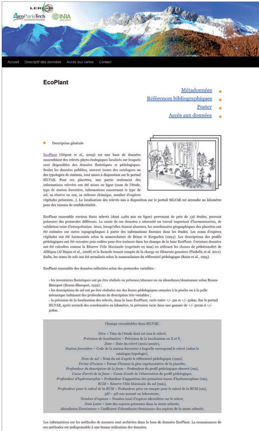
FIGURE 1 EXEMPLE DE FICHE SIMPLIFIÉE DÉCRIVANT LES DONNÉES ECOPLANT DE SILVAE