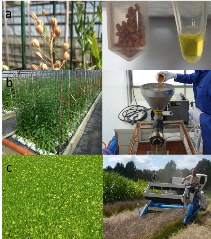
Figure 3. Validation des caractères agronomiques à différentes échelles au cours du processus de sélection des lignées. La plante individuelle permet d'identifier l'évènement de transformation apportant le caractère recherché (a). En particulier l'utilisation d'outils comme la micropresse permettant d'extraire l'huile de quelques centaines de graines (à droite). La descendance des plantes sélectionnées sont ensuite cultivées et validées en serre avec plusieurs centaines d'individus (b). Plusieurs kilos de graines peuvent ensuite être pressés par une mini-presse (à droite). Enfin, les lignées élités peuvent finalement être cultivées au champs (c).